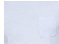
610 Lavender Lustre