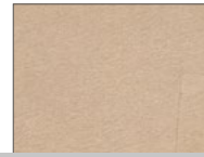
129 Mojave Desert