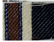
28K Blue Brown Beige