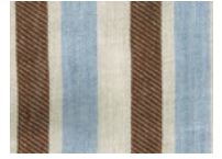
B83 Light Blue Brown Beige