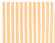
D67 Mustard white