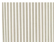
85H GREEN white