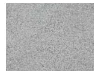
L96 Gray melange