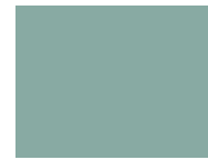
616 Blue surf