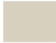
124 Almond milk