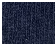
G163 Navy blue