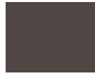
244 Demitasse Brown