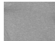
L97 Grey Melange