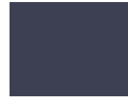
687 Dress Blue