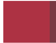
437 Cherry Red