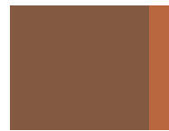
229 Caramel caffè