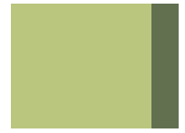
701 Celery green