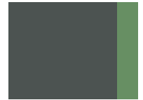
799 Climbing Ivy