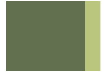
747 Cedar green