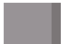
843 Pearl Grey