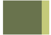
747 Cedar green