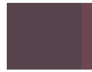
497 Wine red