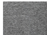
L98 Grey melange