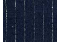
U25 Blue stripes