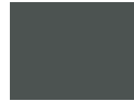
799 Climbing Ivy