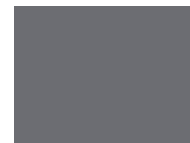
855 Smoked Pearl