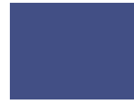
661 Monaco Blue