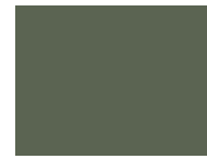
776 Bronze Green