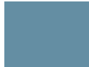
614 Adriatic Blue