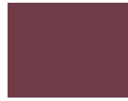
490 Tawny Port