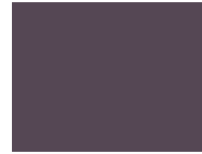
593 Plume Perfect