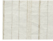
N57 White/Beige Stripes