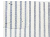
G21 Stripe White Blue