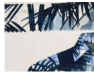
G23 Flowers White Blue