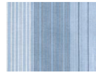
25K Light Blue