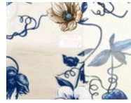
A32 White flowers Blue