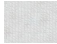
78A White Brown Blue