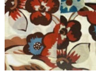
F54 Flowers Red