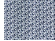
86A White Blue