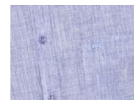
694 Medieval Blue