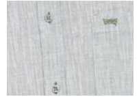
750 Oil Green