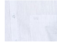
602 Light Blue