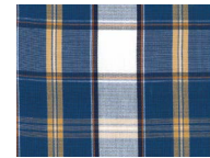
G114 Blue white