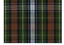
H051 Green brown