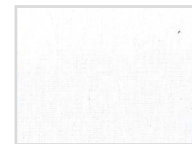
001 Optical White