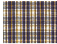
F022 Purple brown