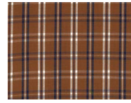
C047 Brown blue