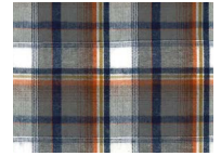
L026 Grey brown