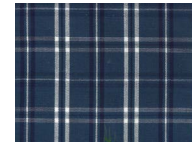
G111 Blue white