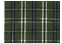
H050 Green blue