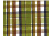
H052 Green brown