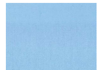
618 Chambrey blue