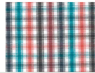
E017 Pink multicolor