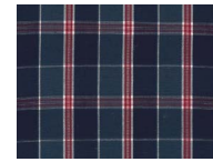
G113 Blue red