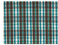
C049 Brown turquoise