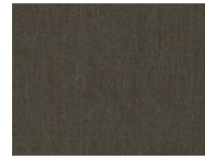
244 Demitasse brown