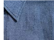
G130 Blue denim