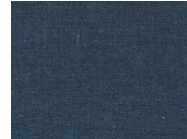
673 Poseidon blue