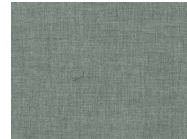
855 Smoked Pearl