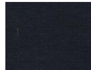
678 Night blue