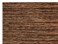
Q06 Brown Melange