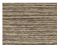
P01 Beige Melange