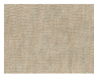
P12 Beige Melange