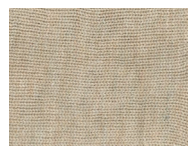
P12 Beige Melange