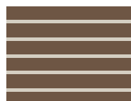
Q20 Brown Stripe