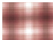
S13 Red Tartan