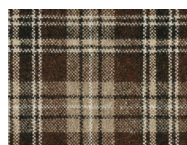
Q13 Brown Tartan