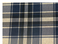
U63 Blue Tartan